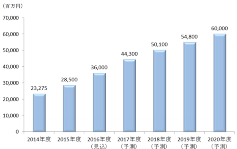
図 1. シェアリングエコノミー(共有経済)国内市場規模推移と予測